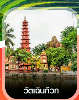
วัดเงินทิว

✈️ คอนเฟิร์มออกเดินทาง ทุกพีเรียด 2 ท่านขึ้นไป