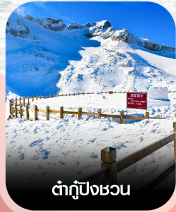
ต้ากู่ปิงชอน