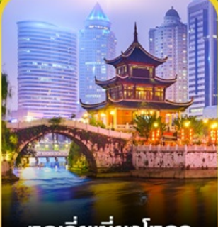
หอเจียเซียงโหลว