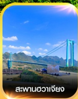
สะพานฮวาเจียง

✈️ คอนเฟิร์ม ออกเดินทาง ✈️ ทุกพีเรียด 2 ท่านขึ้นไป