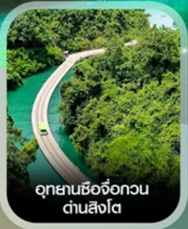
อุทยานช้อจ้อกวน ด่านสิงโต

เช็กอิน เมืองโบราณเซวียนเอิน ชมความงามยามค่ำคืน สัมผัสมหัศจรรย์ ถ้ำหลงหลินกง ธารน้ำสีมรกตใสราวกระจก แกรนด์แคนยอนผิงชาน ล่องเรือชมธรรมชาติ แกรนด์แคนยอนซิงเจียง