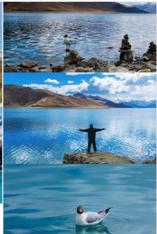
ทะเลสาบ หยัมดรอก (Yamdruk Tso, 羊湖)