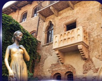
เยือนบ้านจูเลียต เวโรนา