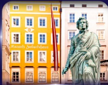
บ้านเกิดโมซาร์ท ซาลซ์บูร์ก