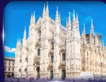
เข็ควินวิหารดูโอโม มิลาน