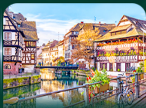
เทียวยัลซาซ สตราสบูร์ก