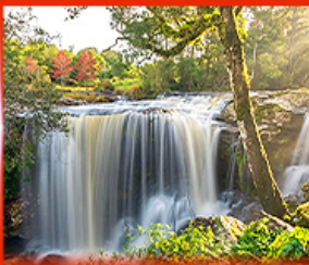
น้ำตกเพ็ญพบใหม่