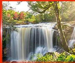
น้ำตกเพ็ญพบใหม่