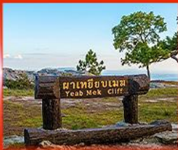
ผาเหยียบเมฆ