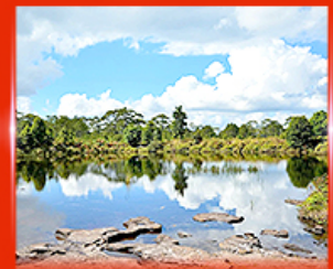
สระอินตาต