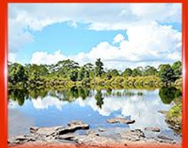
สระอินตาต