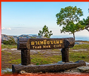
ผาเหยียบเมฆ