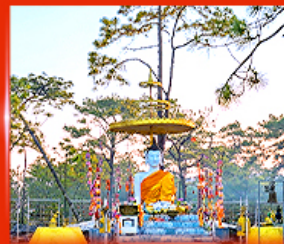
พระพุทรมตตา ลานพระแก้ว