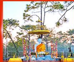
พระพุทธรูปเมตตา ลานพระแก้ว