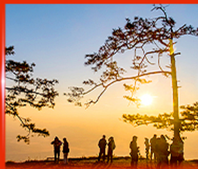
ผานกแอ่น