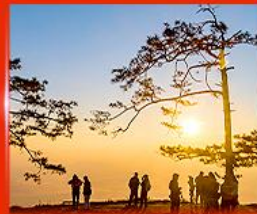
ผานกแอ่น