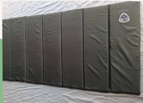
ที่รองนอน