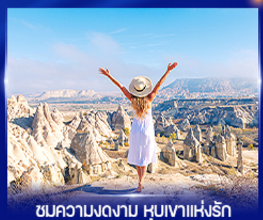
ชมความงดงาม หุบเขาแห่งรัก