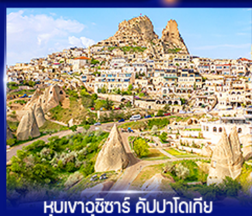
หุบเขาอูซึซาร์ คัปปาโดเกีย