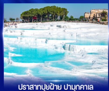
ปราสาทบุงดาีย ปามุกคาเล