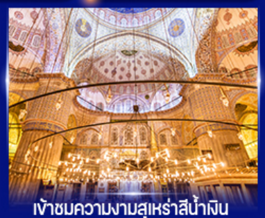
เข้าชมความงามสุเหร่าสีน้ำนิน