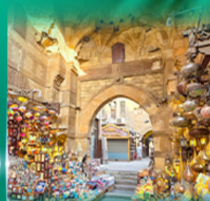
ตลาดผ่านเอลคาลีลี