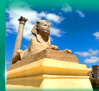
เสารัมเบส ปอมเปอี