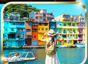
หมู่บ้านประมงเจียงปิ่น