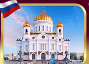
มหาวิหารเซนต์ซาวีร์