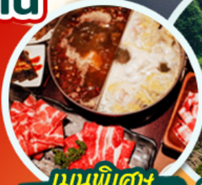
เมนูพิเศษ ชาบูหม่าล่า