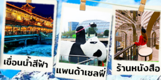
เขื่อนน้ำสีฟ้า