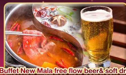
*Buffet New.Mala free flow beer& soft drink