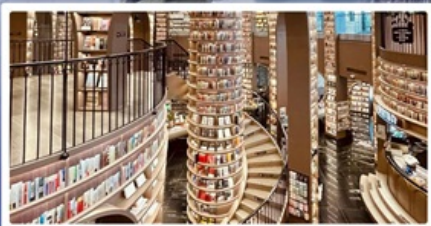
ร้านหนังสือจตุจักร