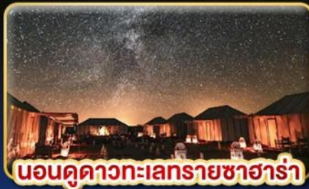
นอนดูดาวทะเลทรายซาฮารา