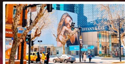
ถนนหวยไห่มีดัดส์โรด