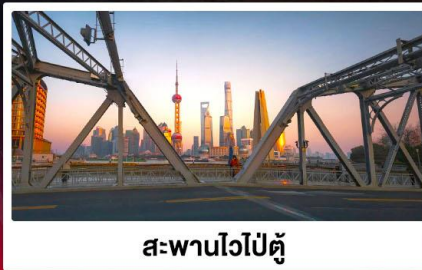
สะพานไวไห่ตุ๋