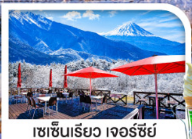
เซชินริเยว เจอร์ซีย์

หมู่บ้านมรดกโลกชิราคาวาโกะ | ชมวิวฟูจิ ริมทะเลสาบคาวากูจิ เซชินริเยว เจอร์ซีย์ ระเบียงชมวิวภูเขาไฟฟูจิและเทือกเขาแอลป์