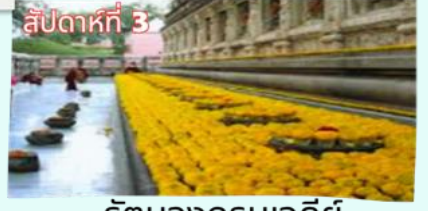
สัปดาห์ที่ 3 รัตนงกรมเจดีย์