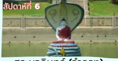
สัปดาห์ที่ 6 สระมูจลินทร์ (จำลอง)