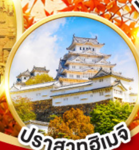
ปราสาทโอเมจิ