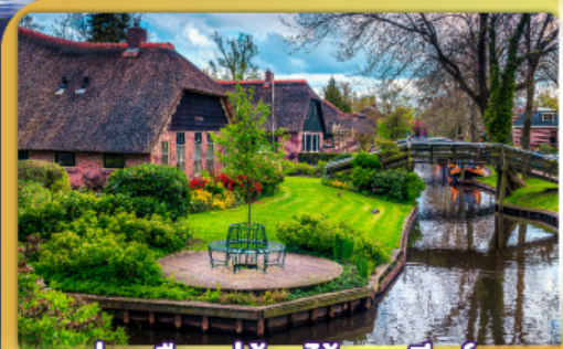
ล่องเรือหมู่บ้านไรทนนท์ริฐัน