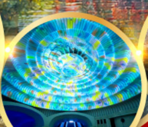
พิพิธภัณฑ์ศิลปะ MOA