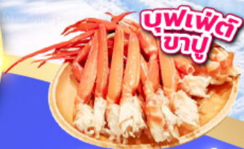
บุฟเฟ่ต์ ซาซิมิ

เที่ยวชมงานประดับไฟ YOKOHAMA ILLUMINATION อิสระท่องเที่ยว ช้อปปิ้งหนึ่งวันเต็มในโตเกียว