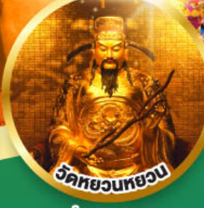
วัดหยวนทวยวน

ขอพรเรื่องสุขภาพ, โชคลาภ ความเจริญก้าวหน้า