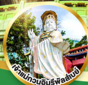
เจ้าแม่กวนอิมพรหมสันติ