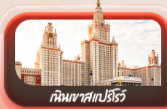
เห็นเขาสเปร์โร