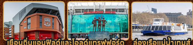
เยือนดินแอนฟิลด์และโอลด์แทรฟฟอร์ด | ล่องเรือแม่น้ำเทมส์

London Stonehenge Liverpool Manchester Stratford Upon Avon