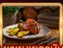
เมนูพิเศษ!! Ribs of Vienna, ปลาเทราสย่าง, ซาหมุยเยอรมัน