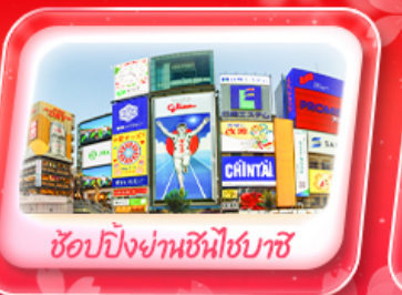
ช้อปปิ้งย่านชินโจบุชิ