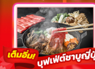
เต็มอิ่ม บุฟเฟ่ต์ชาบูญี่ปุ่น