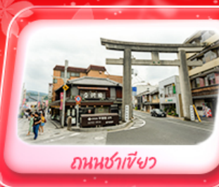
ถนนชาเม็งว

Highlight ชมความงามหมู่บ้านมรดกโลก หมู่บ้านชิราคาวาโกะ เมืองเก่าทาคายามา ทะยานสู่ฟ้า กำแพงวิว Panorama ขึ้นกระเช้าลอยฟ้าโทโซโซ พลาดไม่ได้ ปราสาทโอซาก้า วัดเมียวโดอิน ถนนชาเม็งว โอโมเตะเซนโด ช้อปปิ้งย่านชินโจบุชิ และ Outlet