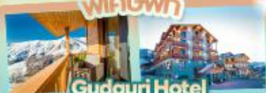
Gudauri Hotel วิวเทือกเขาคอเคซัส