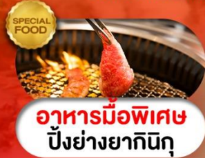
อาหารมือพิเศษ ปิ้งย่างยากินิกุ