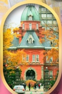
ศาลาว่าการเก่า