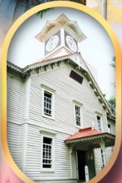
ผ่านชมหอนาฬิกา