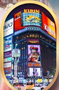
ช้อปบิงย่านซูชิโกะ