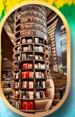
ร้านขายหนังสือ