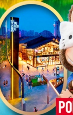
ถนนคนเดินไท่กู่หลี่