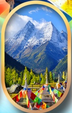
อุทยานสีดรุณี