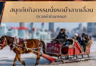
สนุกกับกิจกรรมนั่งรถม้าลากเลื่อน (รวมค่ากิจกรรม)