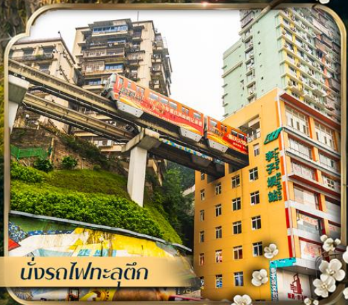
นั่งรถไฟทะลุติ๊ก

คอนเสิร์ตออกเดินทาง ตั้งแต่ 10 ท่าขึ้นไป