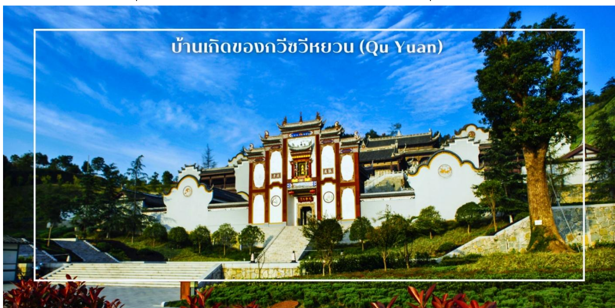
บ้านเกิดของกวีชวีหยวน (Qu Yuan)

นำท่านเดินทางสู่ บ้านเกิดของกวีชวีหยวน (Qu Yuan) สถานที่เกิดของบุคคลสำคัญทางประวัติศาสตร์และวรรณกรรมของประเทศจีน ผู้ได้รับการยกย่องว่าเป็นกวีผู้ยิ่งใหญ่แห่งยุครัฐจ้านกั๋ว และเป็นสัญลักษณ์แห่งความซื่อสัตย์และความจงรักภักดี บ้านเกิดของชวีหยวนตั้งอยู่ริมแม่น้ำแยงซีเกียง เป็นสถานที่ที่สะท้อนเรื่องราวชีวิต แนวคิด และผลงานทางวรรณกรรมอันทรงคุณค่า ซึ่งมีอิทธิพลต่อวัฒนธรรมจีนสืบต่อมาจนถึงปัจจุบัน (รวมรถแบตเตอร์รี่)