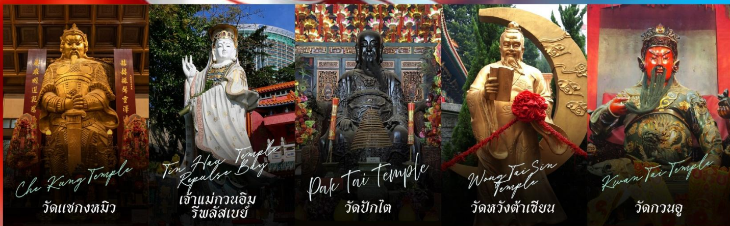
Che Kung Temple วัดแซกซงทมิว

รายการทัวร์ข้างต้นอาจมีการปรับเปลี่ยนเพื่อความเหมาะสม