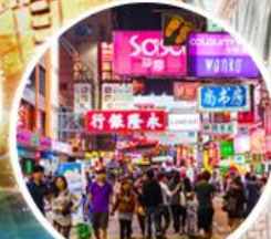
Shopping Taim Sha Tsui