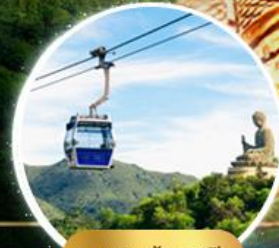
รวมกระเช้านองปิง