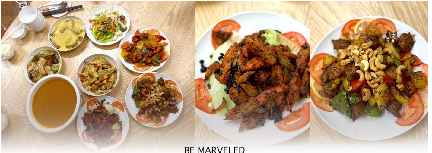
BE MARVELED อาหารเจ

👁️ เที่ยง รับประทานอาหารเที่ยง ที่ภัตตาคาร ***อาหารเจ***