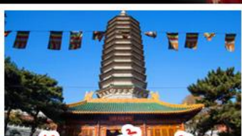
วัดพระเขี้ยวแก้ว