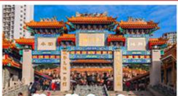
วัดเขว้งต้าเซียน