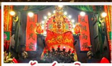
วัดเซกตงเหมียว