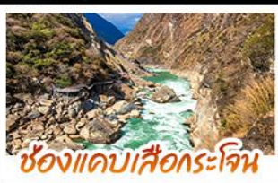
ช่องแคบเสือกระเจิน