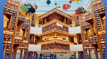
ห้องสมุดดสตาร์ฟิค