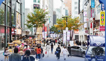
ช้อปปิ้งย่านเม็ยงดง