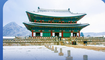
พระราชวังเจ็ยงบุก

สัมผัสเสน่ห์ฤดูหนาวเล่นหิมะแบบจัดเต็มที่สุดที่รีสอร์ท พร้อมกิจกรรมสุดมันส์ทั้งสกี สโนว์บอร์ด และสโนว์สไลด์ ก่อนสัมผัสไฮไลท์สุดชิว วน ทะเลสาบชินจง ลานน้ำแข็งธรรมชาติ ขนาดใหญ่ที่เปิดให้สนุกกับการตกปลาแม่น้ำเพ็ง ปั่นจักรยานเปิด และลากเลื่อน เพียงปีละครั้งเท่านั้น พลาดไม่ได้กับการช้อปปิ้งจุใจที่เมืองดงและฮงแท เกียวสนุก ซ้อป ฟัน ครบทุกสไตล์ในทริปเดียว