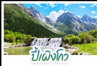
ปี๋เฉิงโกว