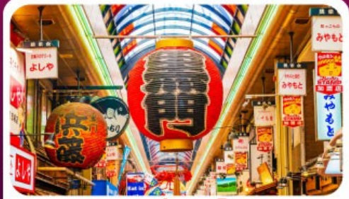
ตลาดปลาคุโรมง