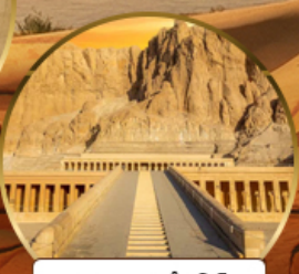
หุบเขากษัตริย์