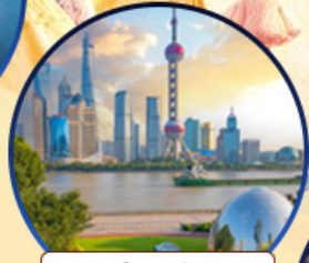
นอร์ตัน กรีนแลนด์