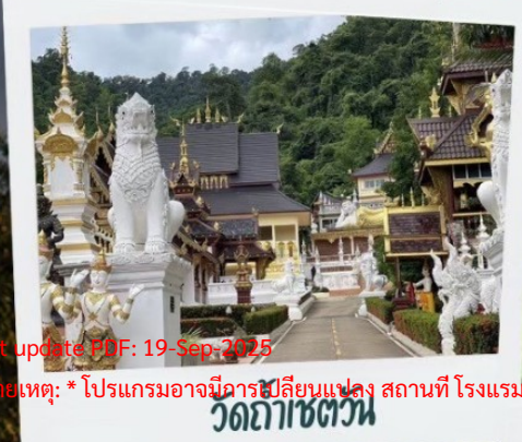
วัดป่าเซตวัน