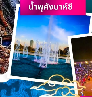
น้ำพุคังบาศี