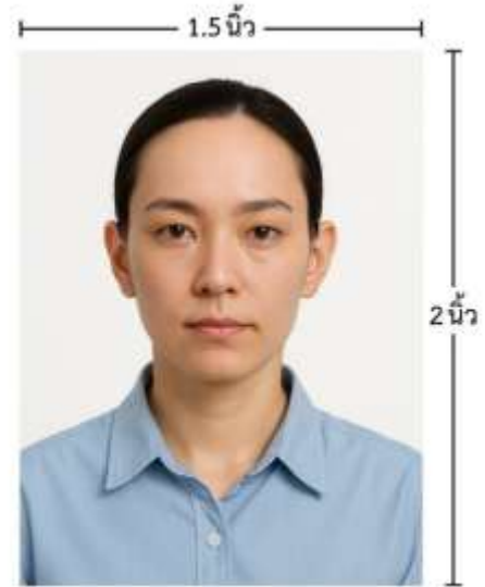
ขนาดรูปตัวอย่างใช้ยื่น Visa

*** ห้ามขีดเขียน แม็ก หรือใช้คลิปลวดหนีบัตรเครดิต ซึ่งอาจส่งผลให้รูปถ่ายชำรุด และไม่สามารถใช้งานได้ ***