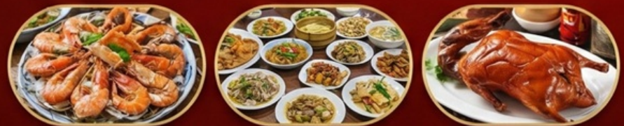
ลิ้มรสเมนูพิเศษ ซีฟู้ดซีงเตา, อาหารแต้จิ๋ว 18 อย่าง, เปิดอย่างกว้างใจ