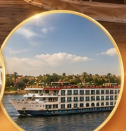
ล่องเรือแม่น้ำไนล์